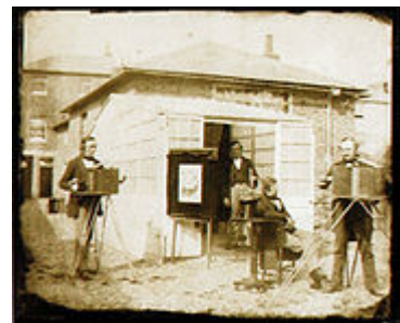
William Fox Talbot, 1853

Objectiu: Donar a conèixer els principals esdeveniments, tècniques i procediments fotogràfics del segle XIX. Donar suport conceptual i històric a la resta de les assignatures i les eines per que l'alumne tingui tant una visió crítica com objectiva de la història de la fotografia.